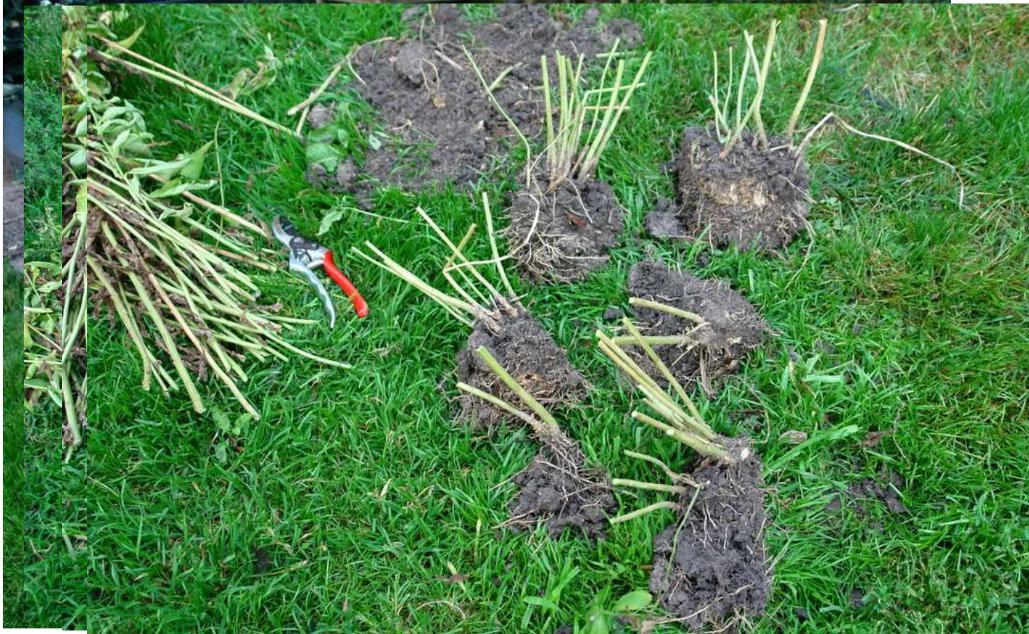
onderhoud kruidachtige beplanting